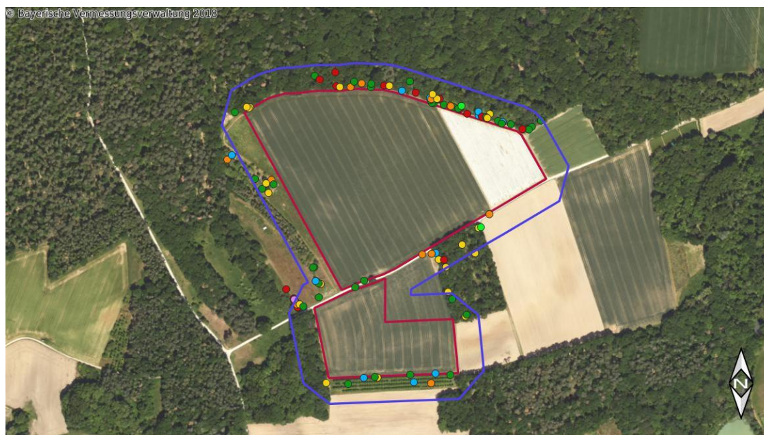
Energiepark Ochsenfurt Süd