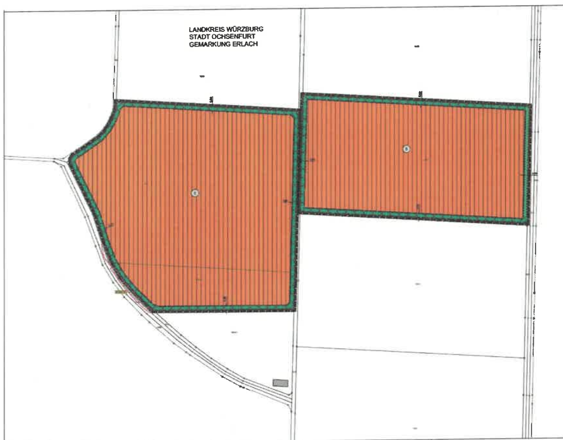
Geltungsbereich ohne Maßstab

Der Stadtrat der Stadt Ochsenfurt hat in seiner Sitzung am 29.02.2024 gemäß § 2 Abs. 1 BauGB den Aufstellungsbeschluss für die Aufstellung des vorhabenbezogenen Bebauungsplans „Photovoltaikanlage Erlach 2 Nord“ im Ortsteil Erlach beschlossen. Der Geltungsbereich umfasst im nördlichen Bereich die Flurstücke Fl. Nr. 1894, 1894/2, 1934 Gemarkung Erlach mit einer Fläche von 11,93 ha.